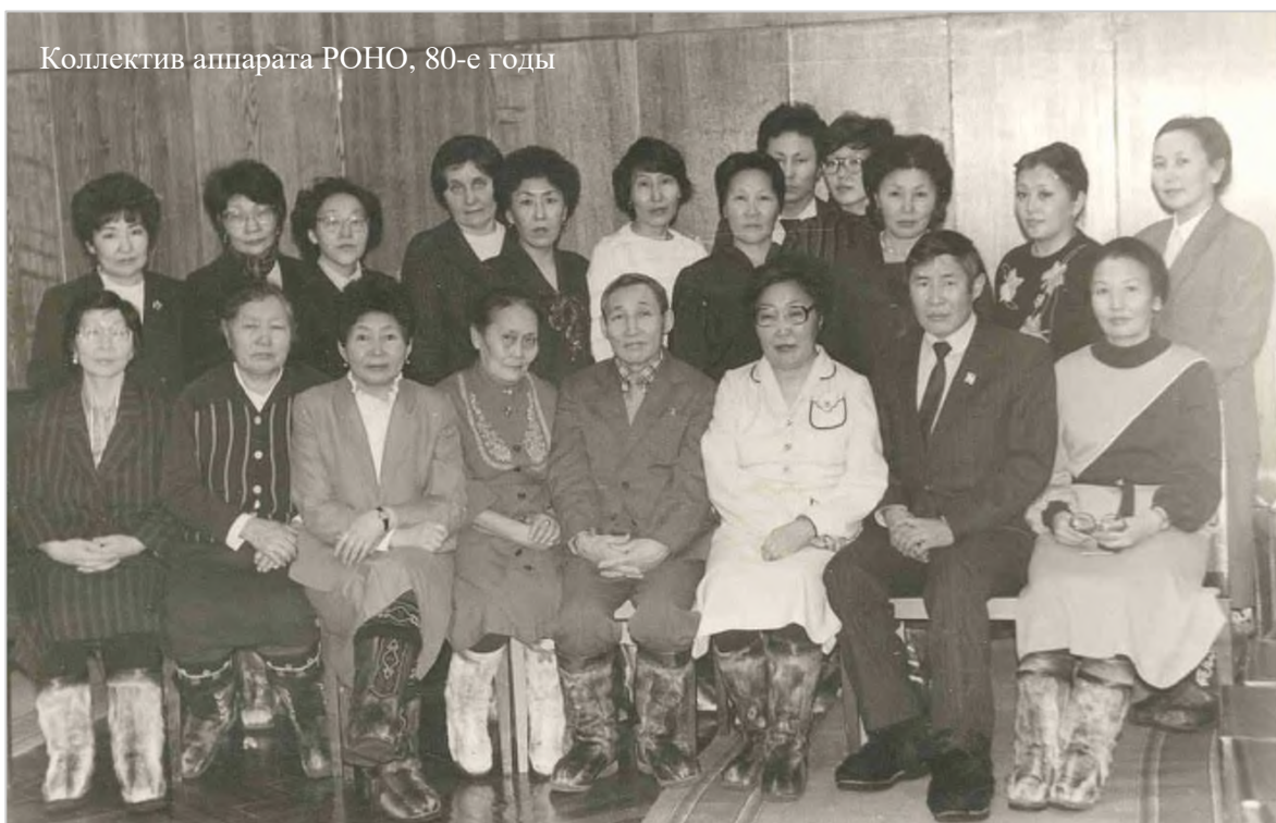
Коллектив аппарата РОНО, 80-е годы