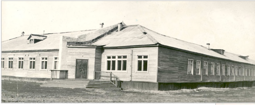
Типовой проект школы 70-х.