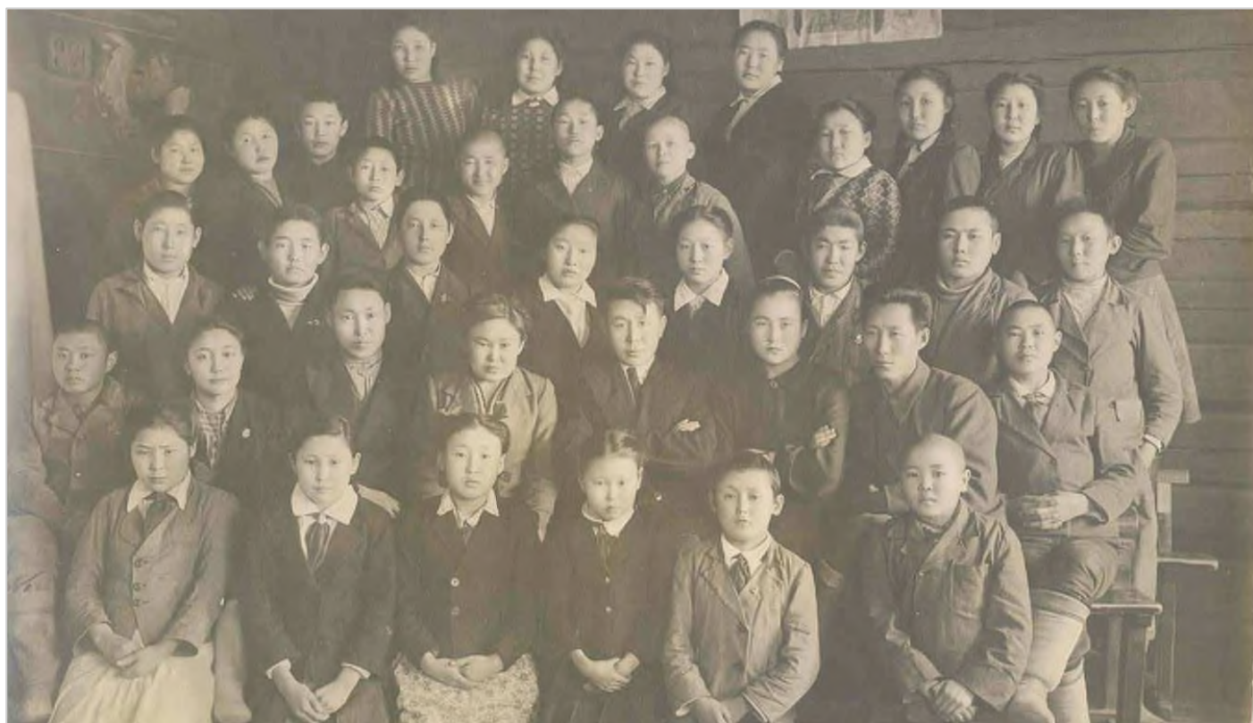
Коллектив учителей Булгунняхтахской школы с учащимися 6-го класса, 1948-1949 уч. г.