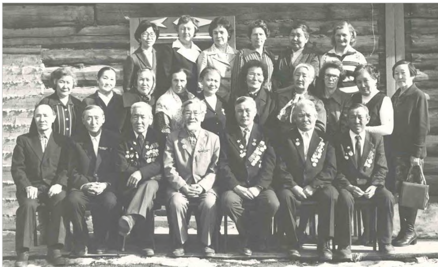
Ветераны педагогического труда, 1985 г.