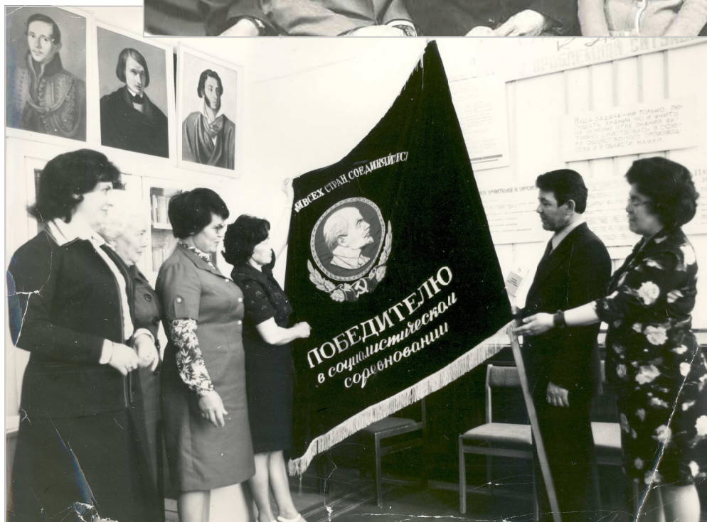
Коллектив Мохсогolloхской средней школы – победитель социалистического соревнования, 80-е годы