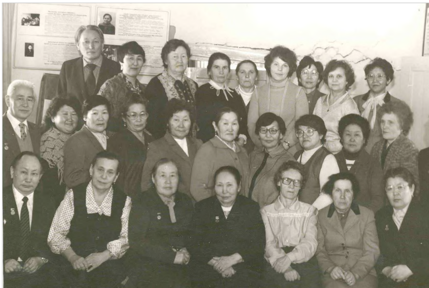
Ветераны педагогического труда, 1980 гт.