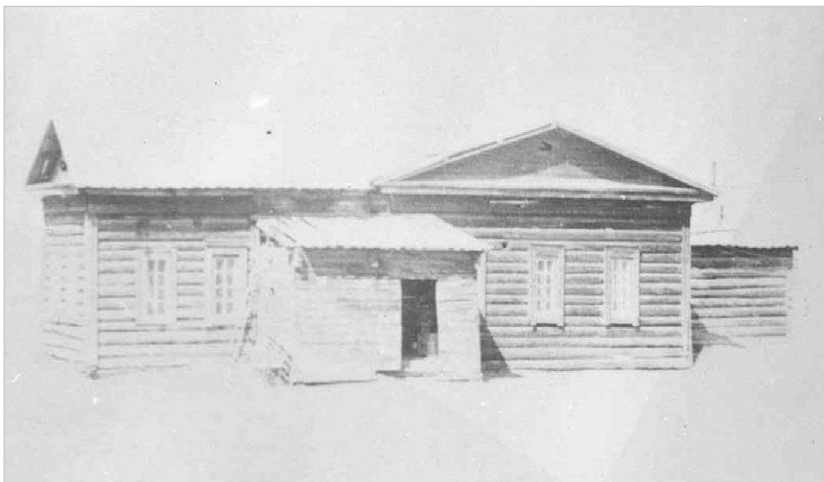
Здание первой школы улуса