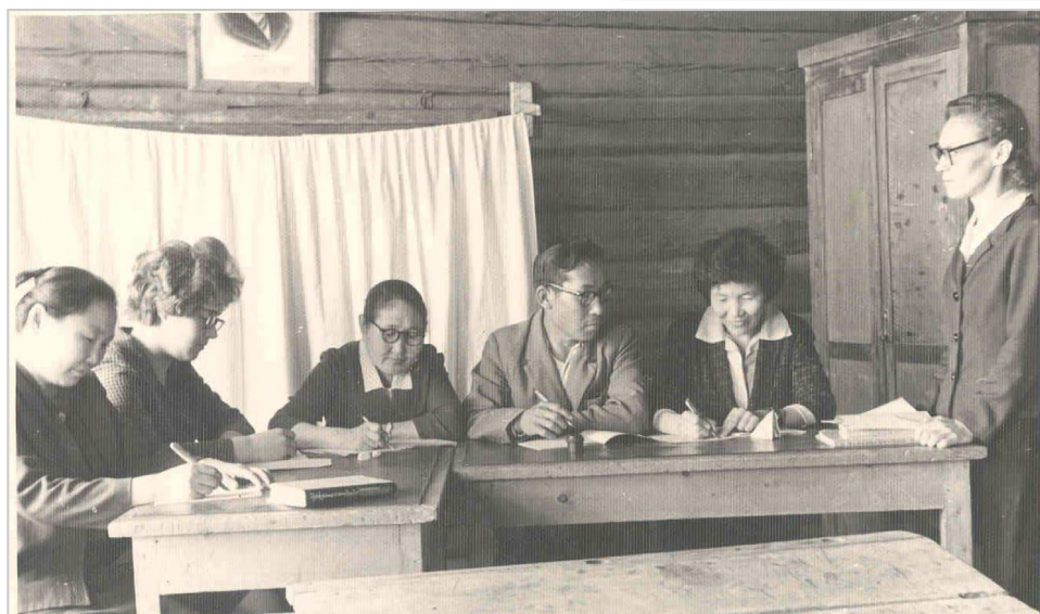
Педагогический коллектив Булгунняхтахской школы, 1960 г.