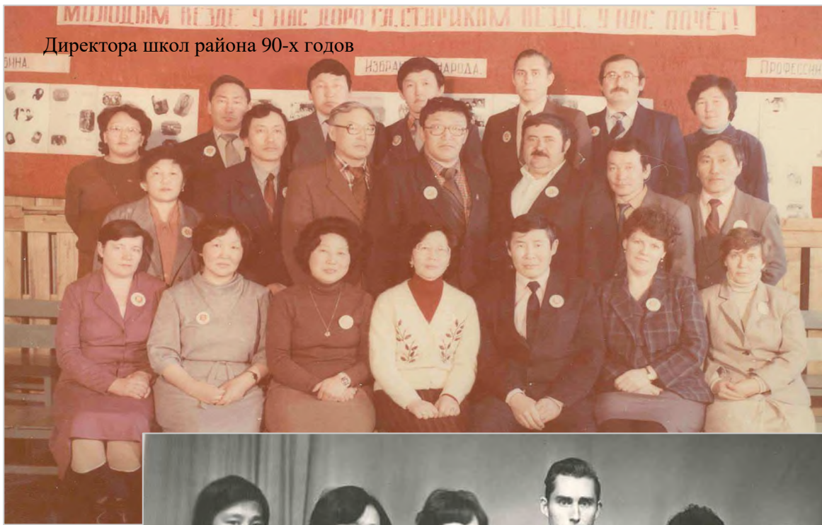
Директора школ района 90-х годов