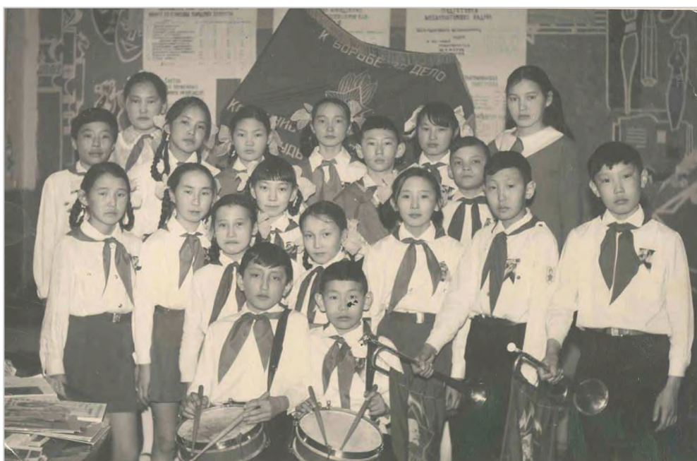
Пионеры. Покровск, 1971 г.