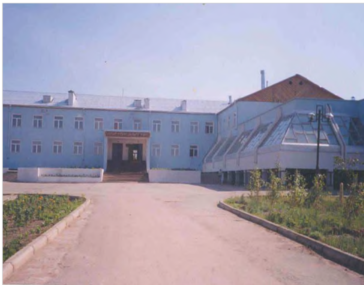
Здание Октемского лицея, построено в 1995 г. на средства «Фонда будущих поколений»