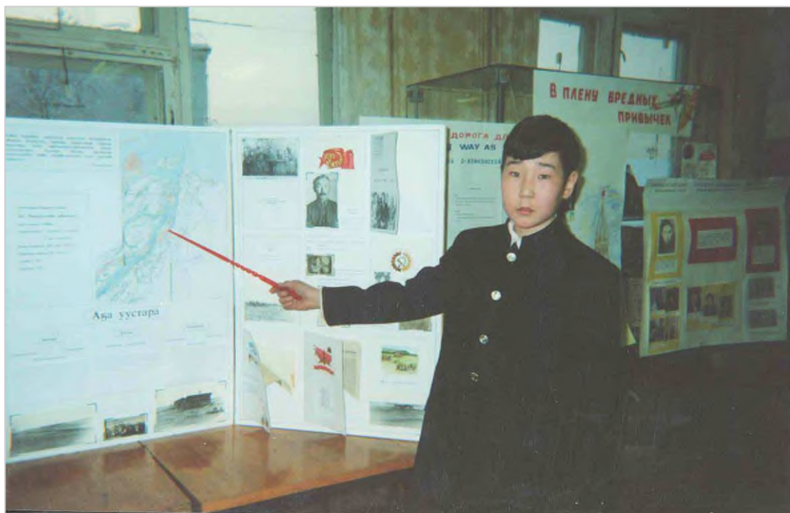
Улусная научная конференция «Шаг в будущее», 2002 г.