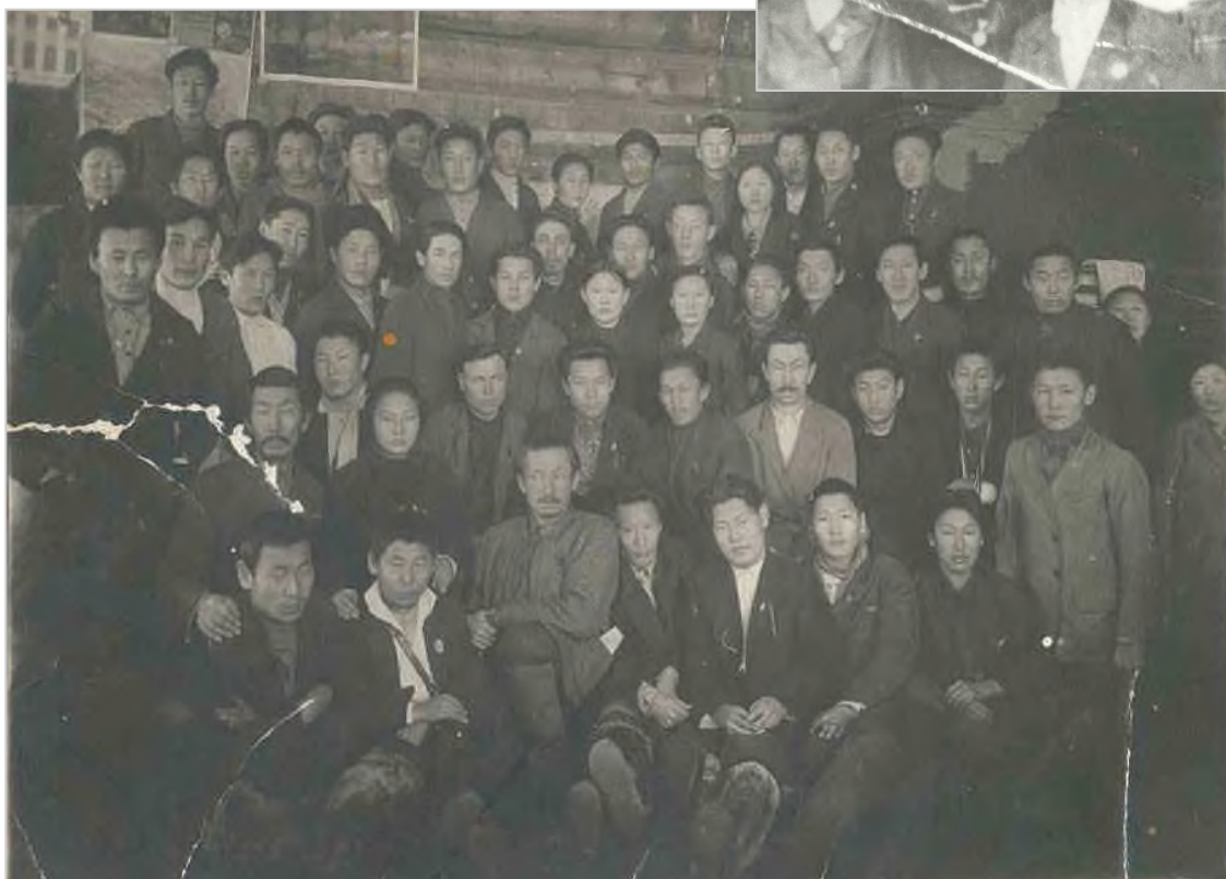
3-я учительская конференция Западно-Кангаласского улуса, 1934 г.