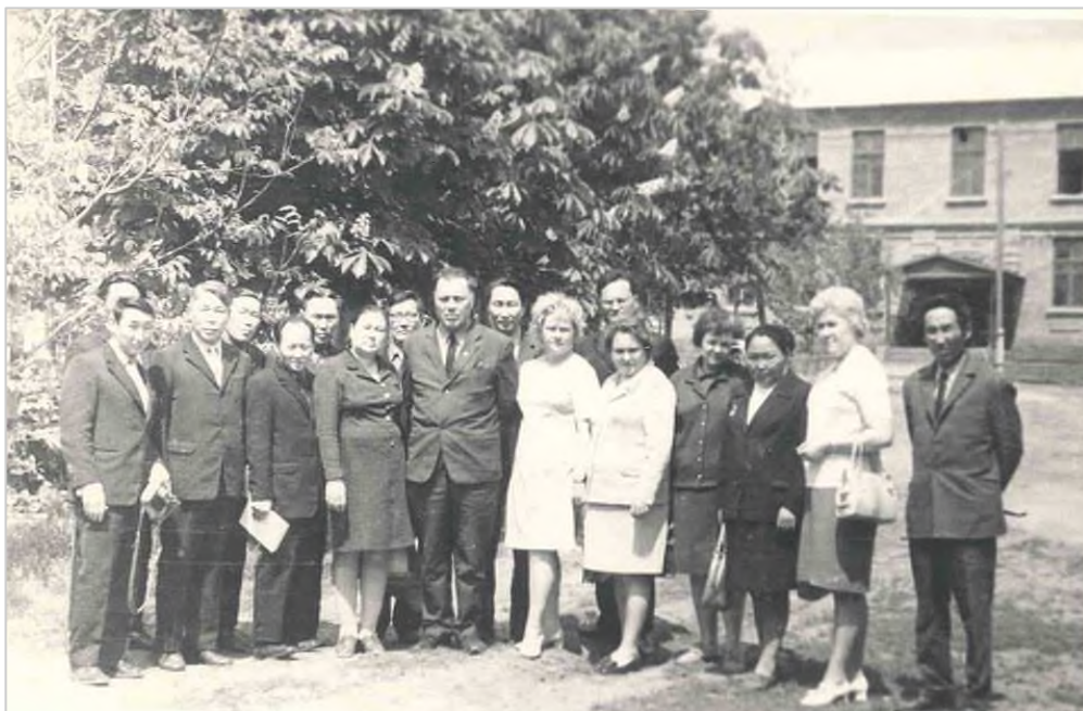
Делегация Якутии с братом В. А. Сухомлинского, Павлыш, 1973 г.