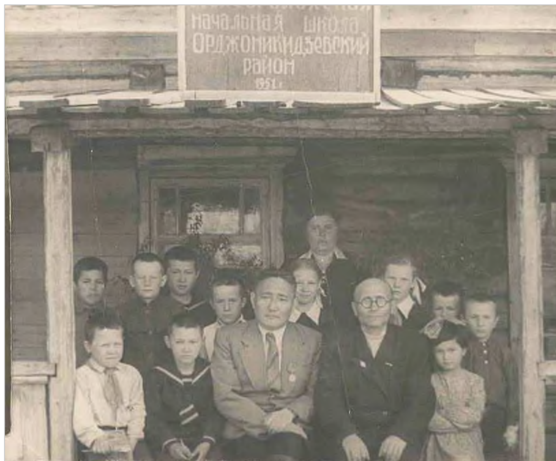
Учителя и учащиеся Мохсоглохской начальной школы, 1952 г.