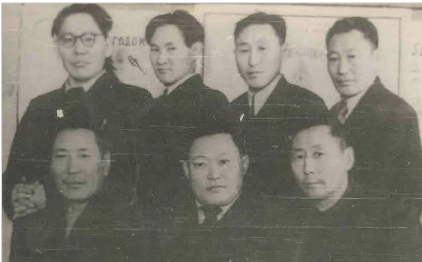
Учителя Октемской школы, 1958 г.