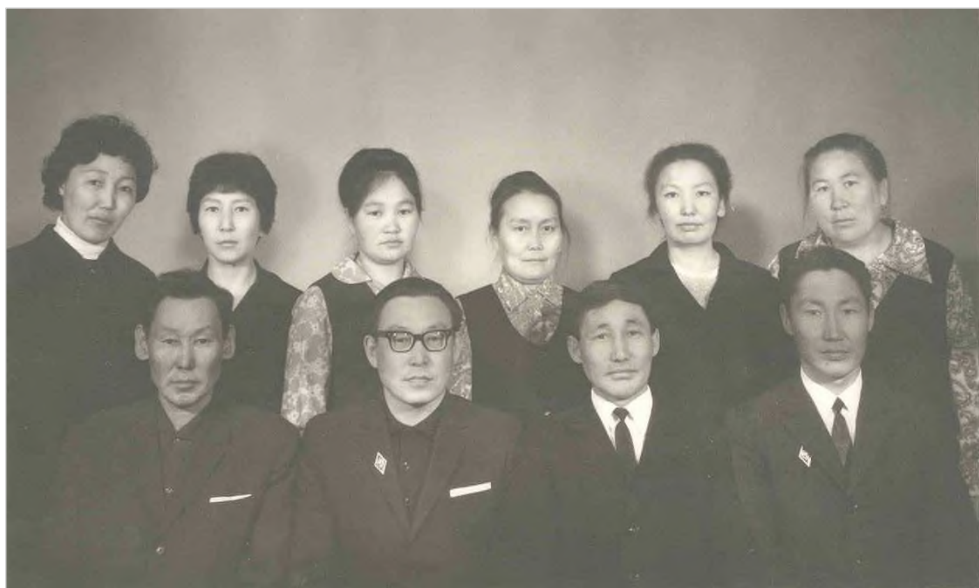
Коллектив аппарата РОНО, 1969 г.