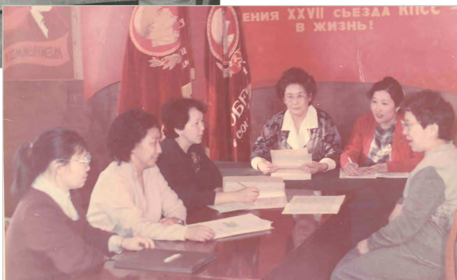
Совещание учителей Ойской школы