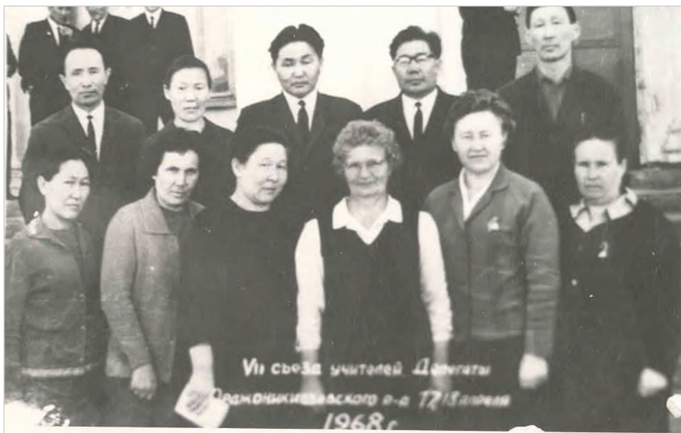
Делегаты Орджоникидзевского района в VII съезде учителей, 1968 г.