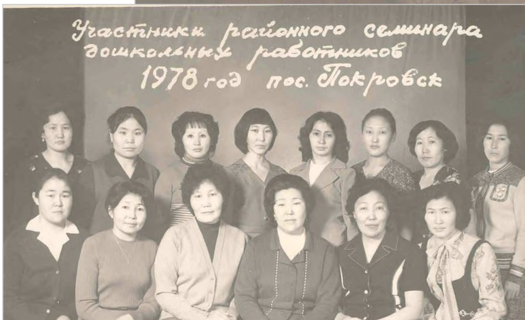
Участники районного семинара дошкольных работников 1978 год пос. Токровск