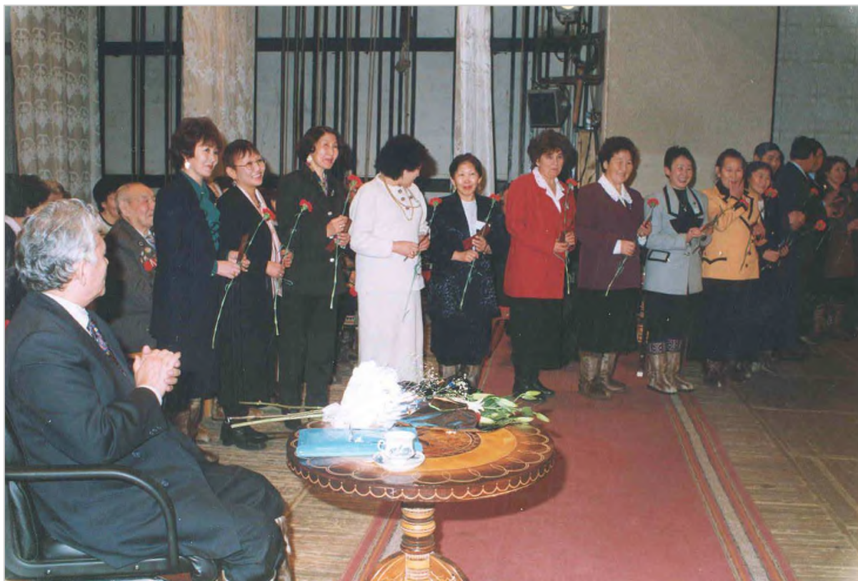
Вручение наград на 125-летнем юбилее образования в улусе