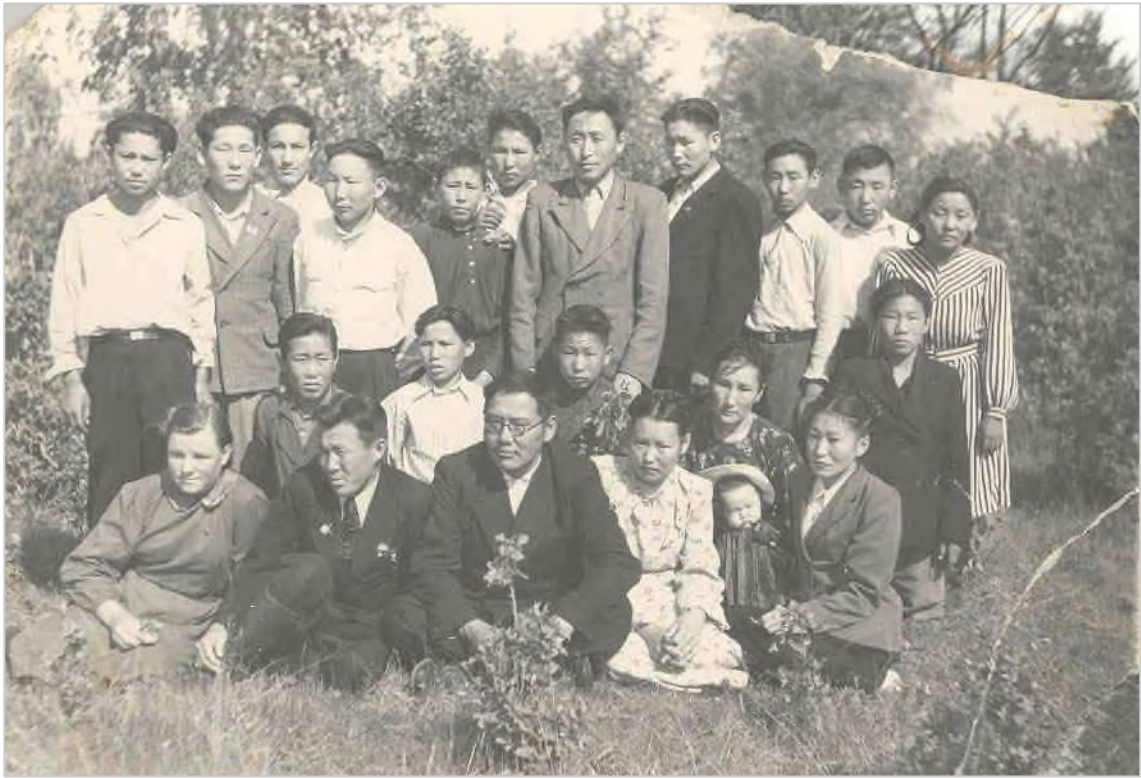
Учителя и учащиеся Октемской школы, 1952 г.