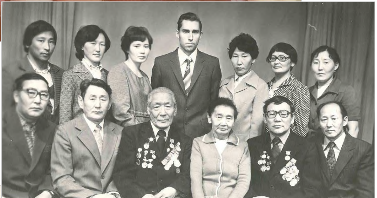
Коллектив учителей Покровской ОЗШ, 1981г.