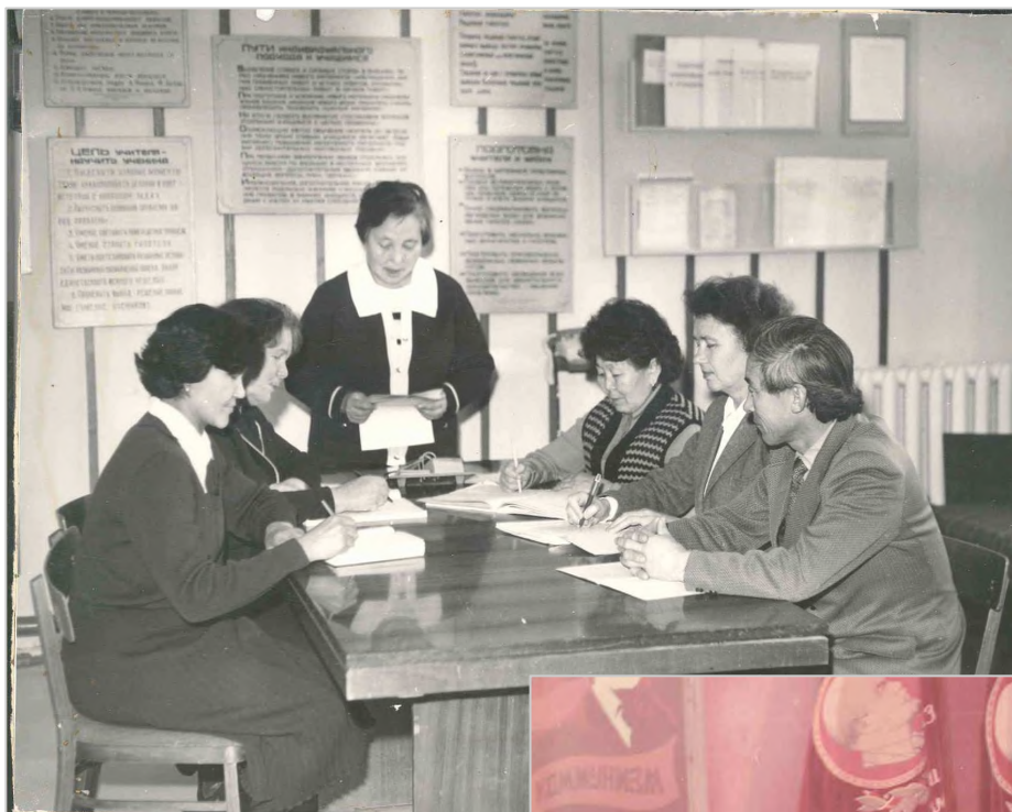
Совещание при директоре в ПСШ №2