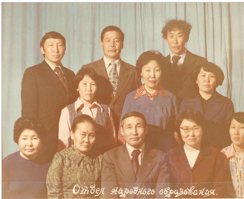
Отдел народного образования.