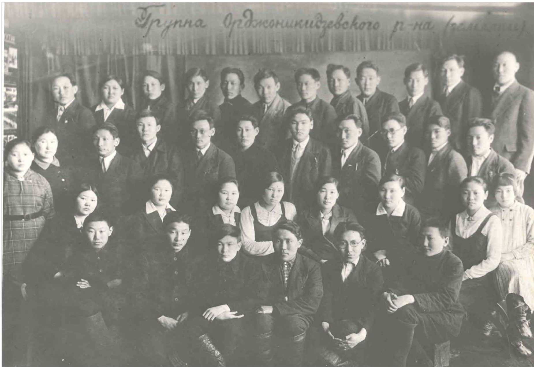
Группа студентов, 1938 г.