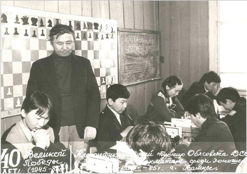
Команда юных шахматистов Октемской школы, 1985 г.

40 лет Великой Победы (1945-85) Ключевцы приняли участие в турнире Облсовета ЭСР среди школьников среди юношей 1945-85 г. в Ключеве.