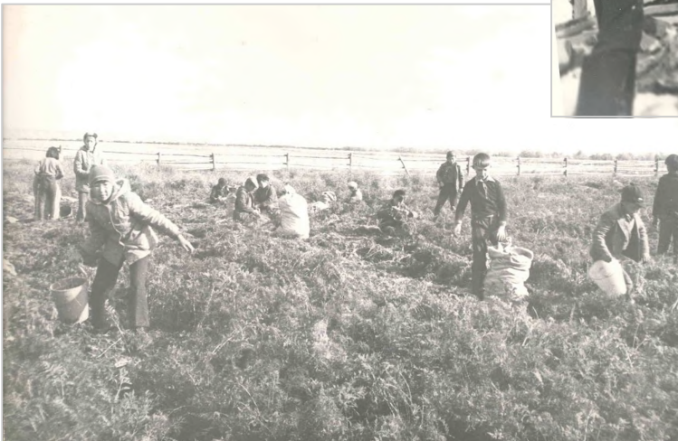
Уборка урожая – обязанность учащихся 1970-80 гг.