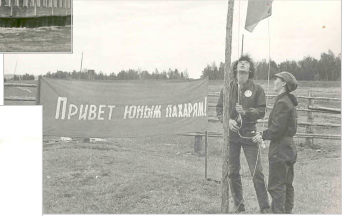
Соревнования юных пахарей, 80-е годы