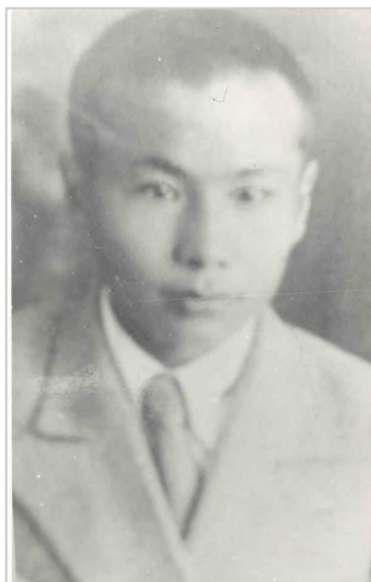
Г.Г. Самсонов – погиб на фронте ВОВ