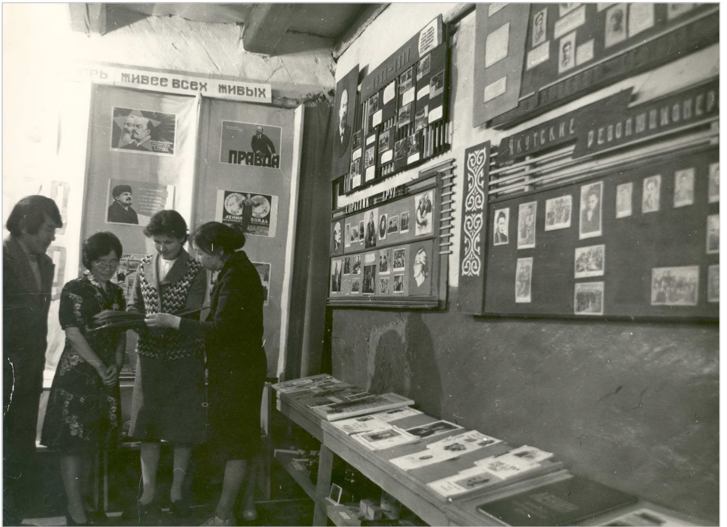
Историко-краеведческий музей Булгунняхтахской школы в 1970-е гг.