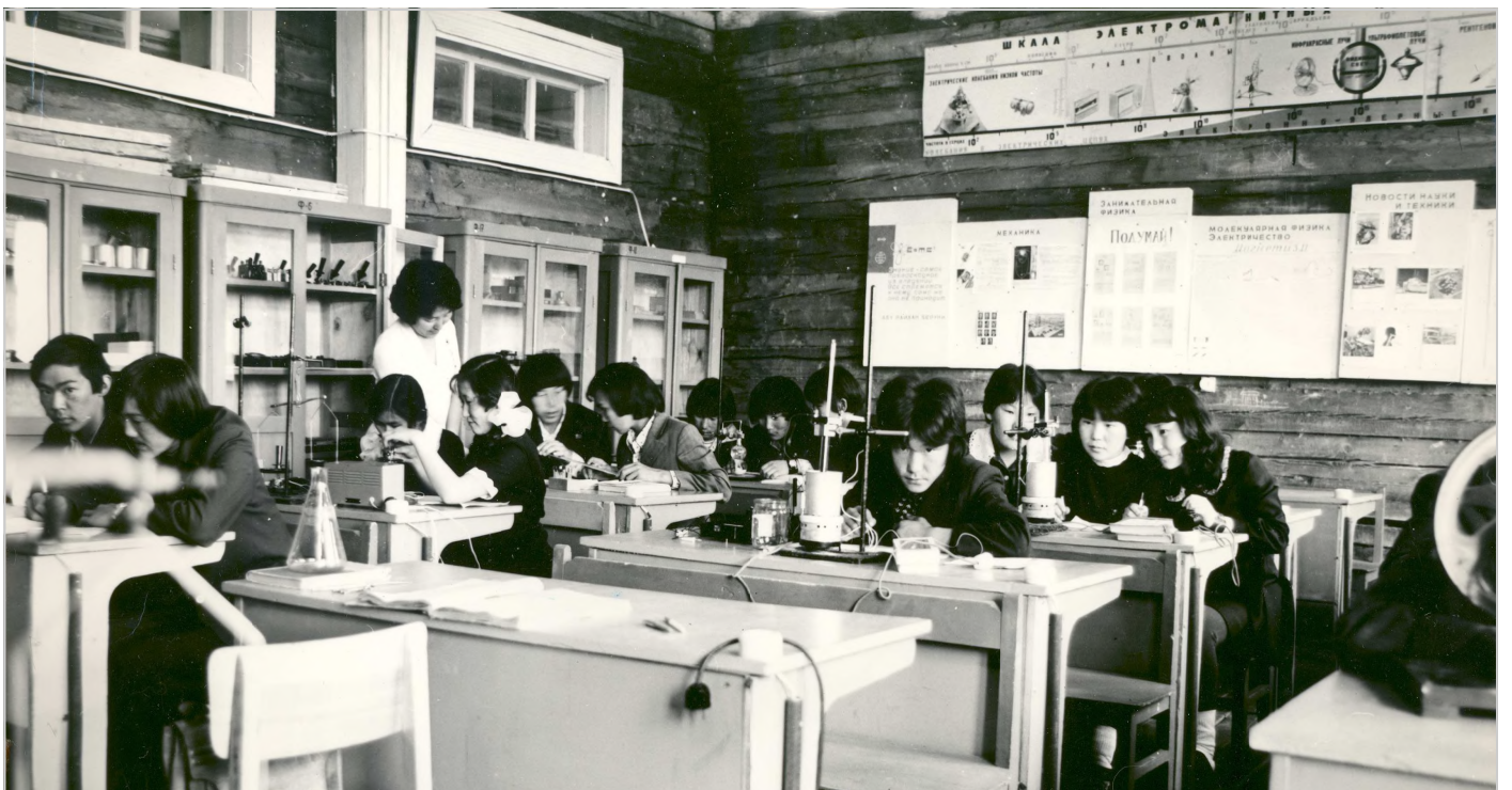
Кабинет физики Октемской средней школы в 70-ые годы.