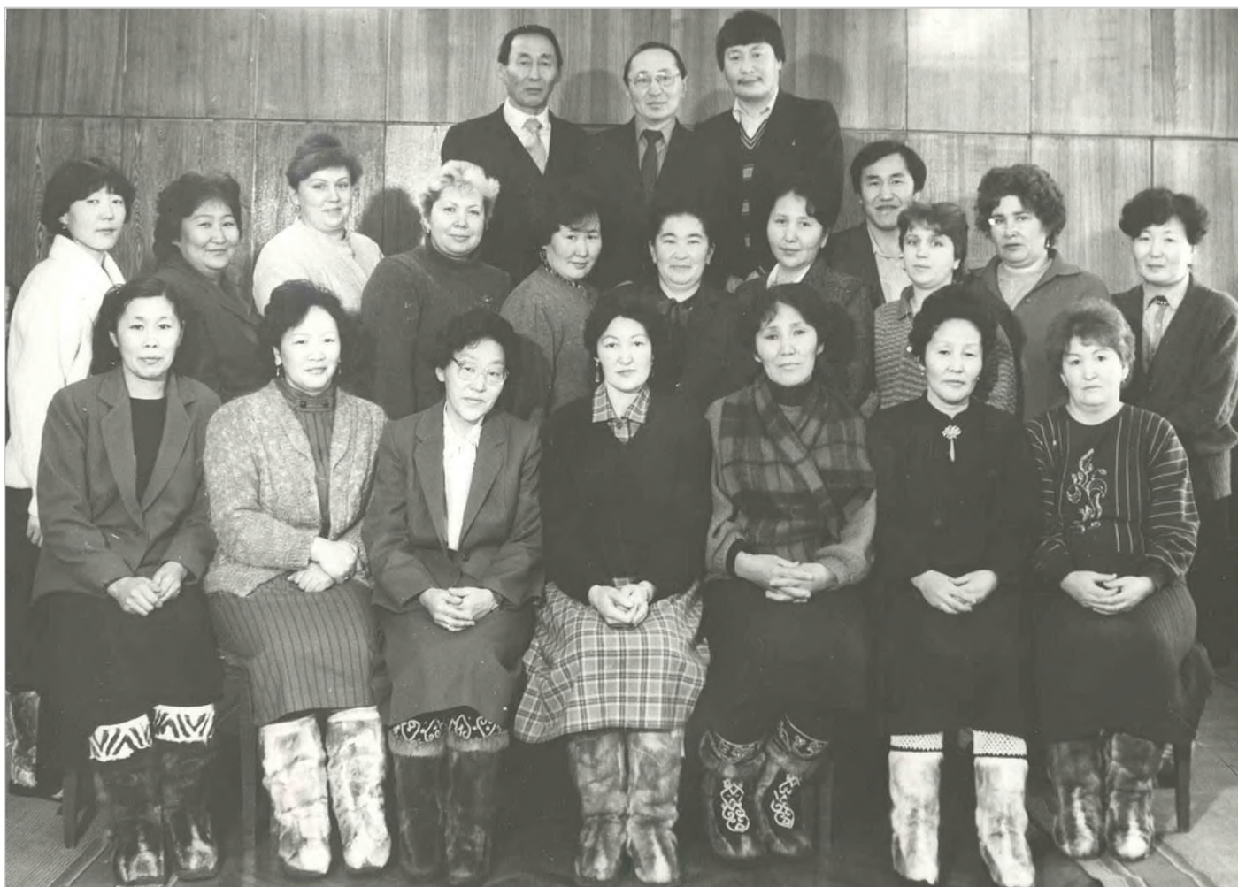
Председатели профсоюзных организаций образовательных учреждений