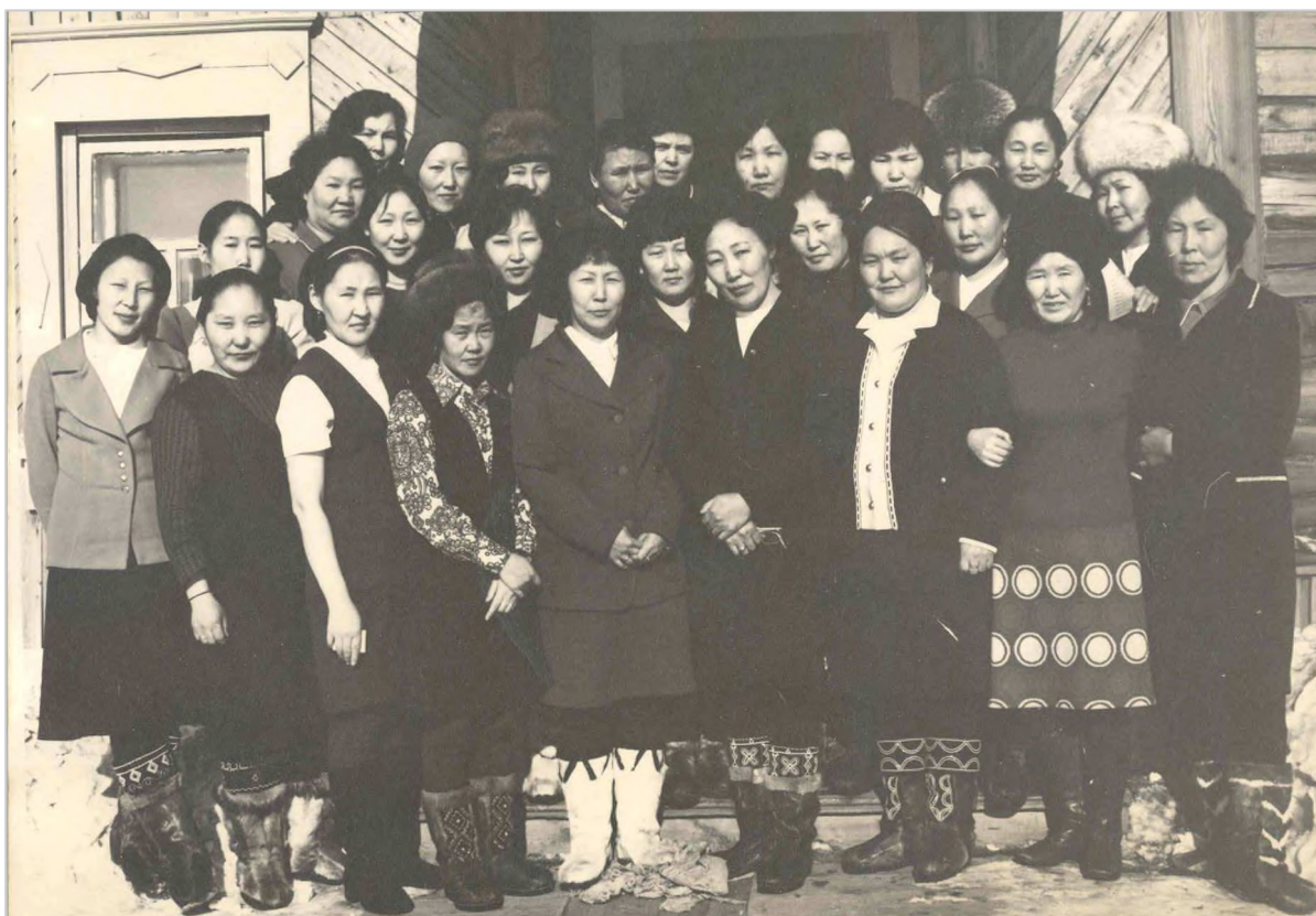
Районный семинар дошкольных работников, 70-е годы