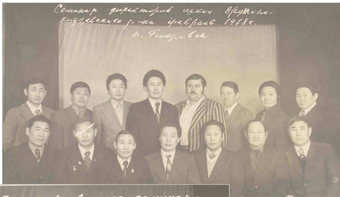
Семинар директоров школ Кудрявского р-на февраль 1978 г. п. Токровск