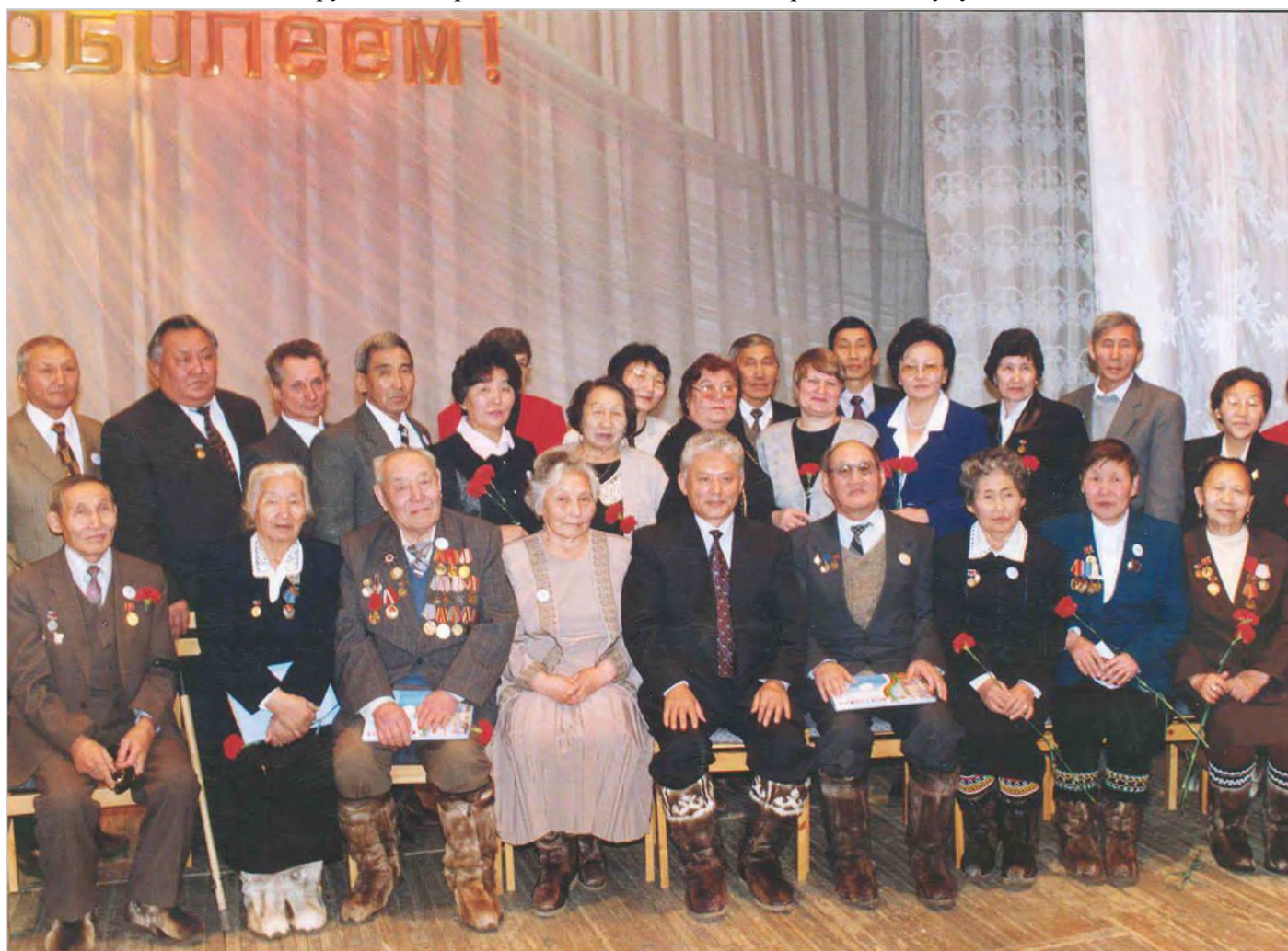
Ветераны педагогического труда с Первым Президентом М.Е. Николаевым, 1999 г.