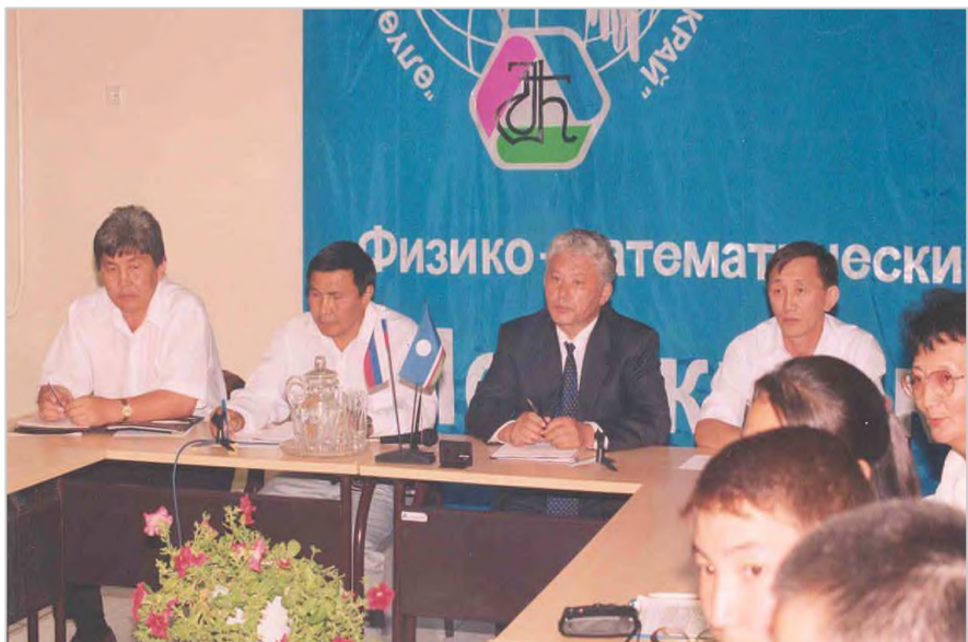
На физико-математическом форуме «Ленский край»