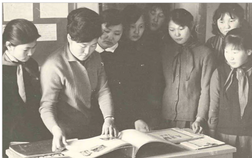
Пионерский актив I Жемконской школы, 1970-е годы