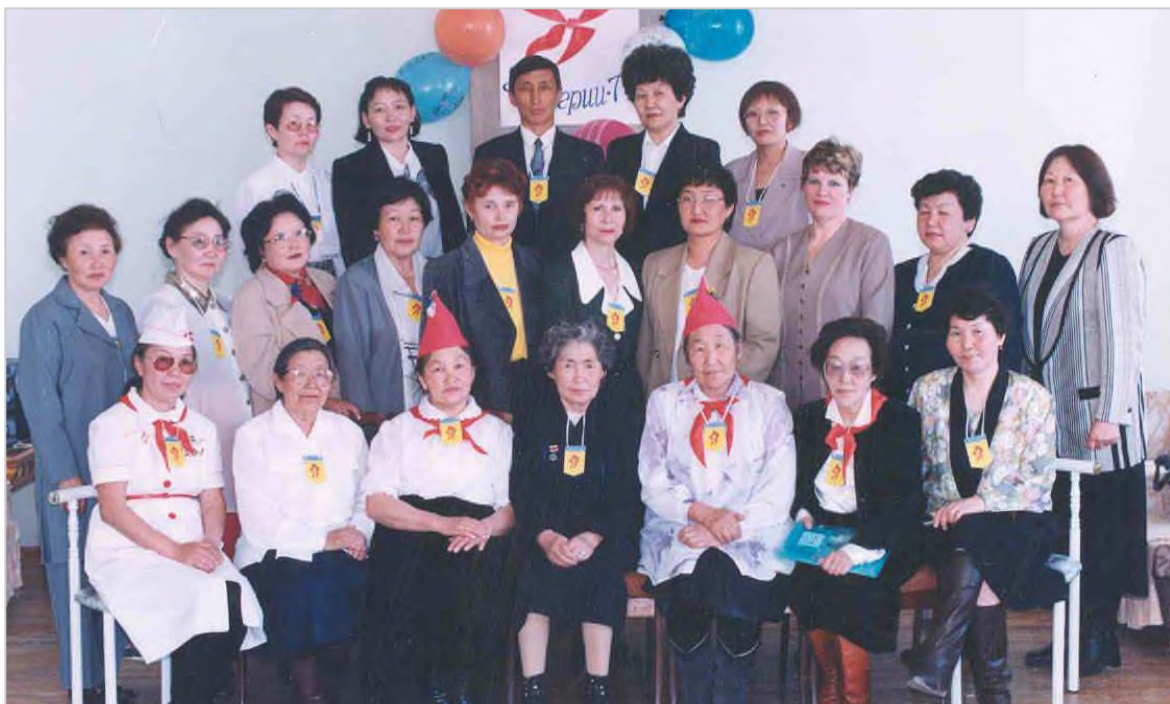
Юбилейная встреча пионервожатых, 2002 г.