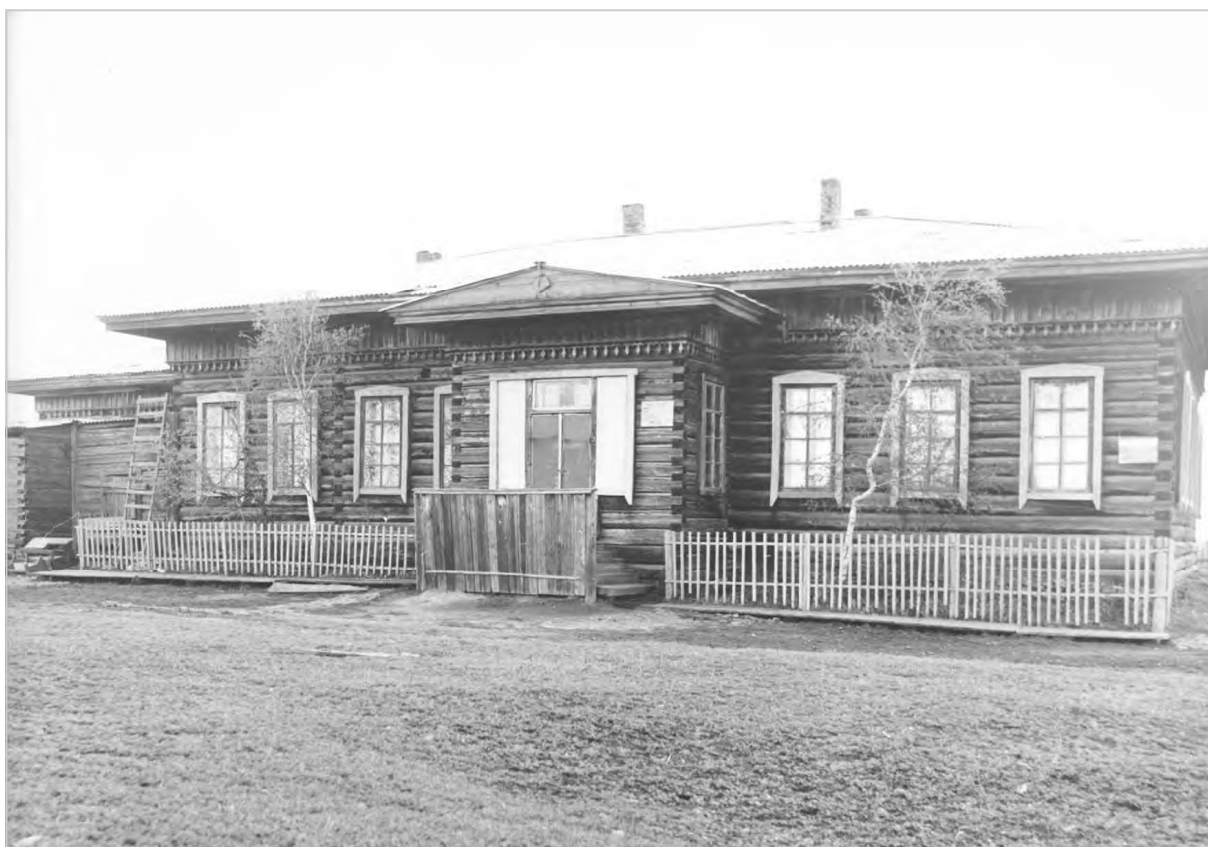
Здание двухклассного Алексеевского училища, построенного в 1914 г.