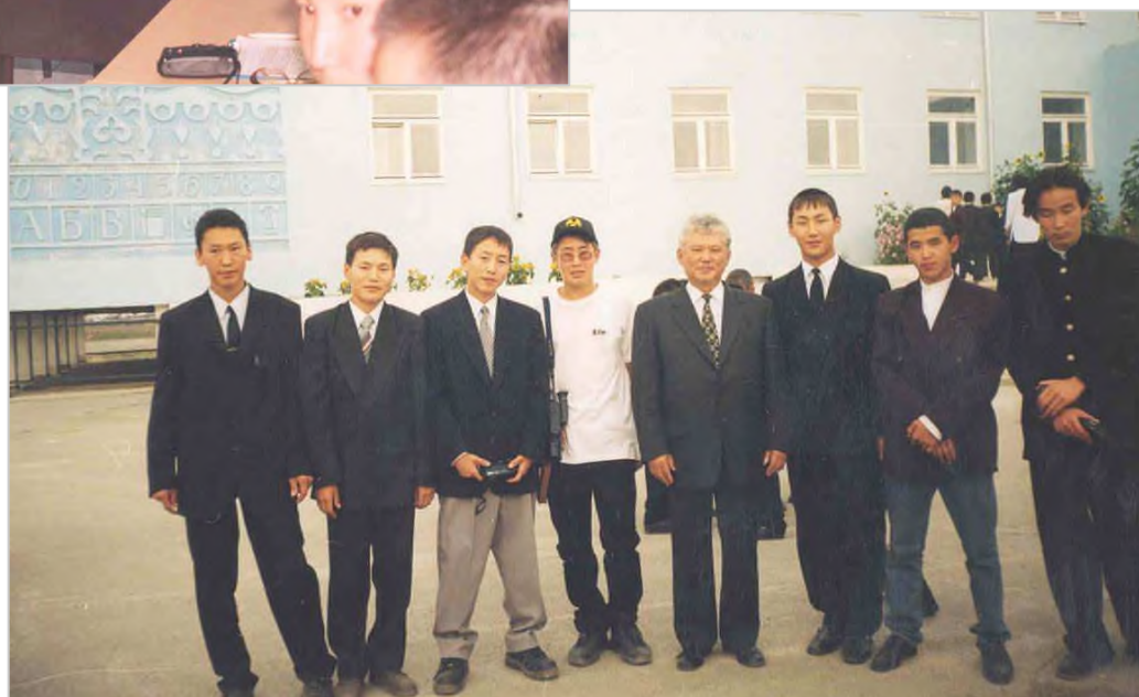
Президент РС(Я) М.Е. Николаев с выпускниками Октемской школы – гимназии, 1998 г.