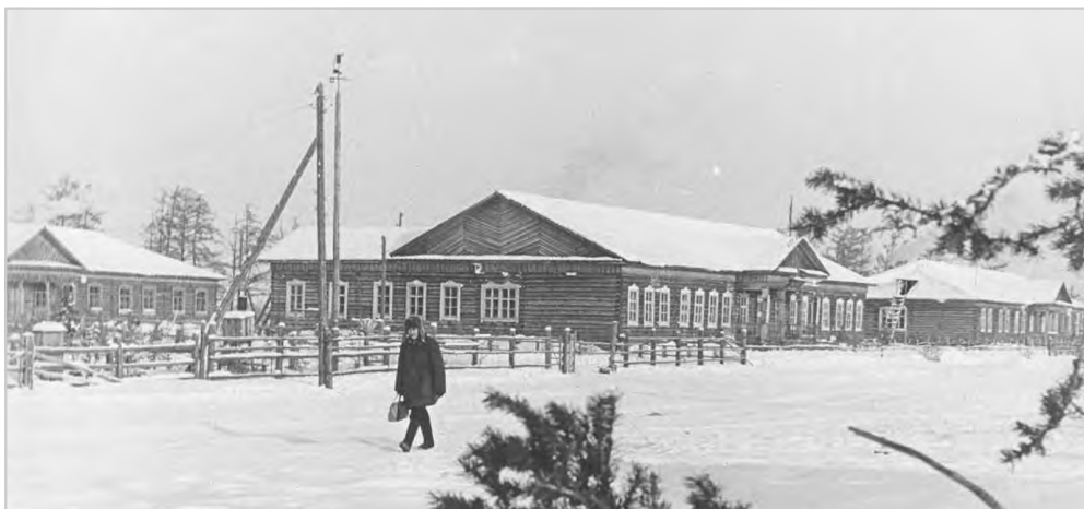
I Жемконская школа – интернат, 1959 г.