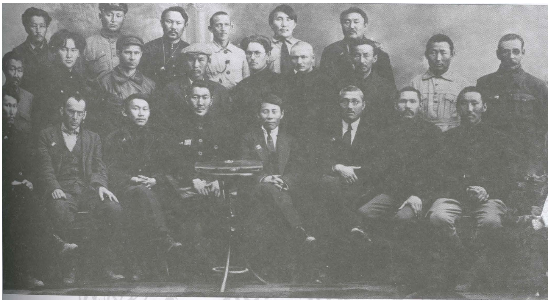
Делегаты I Всеякутского Учредительного съезда Советов. Декабрь 1922 г.