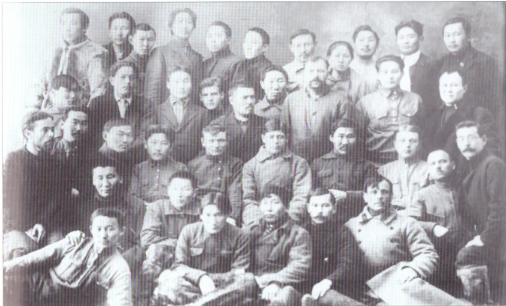
Делегаты 1-го Всеякутского съезда Советов. 27 декабря 1922 г.— 19 января 1923 г.