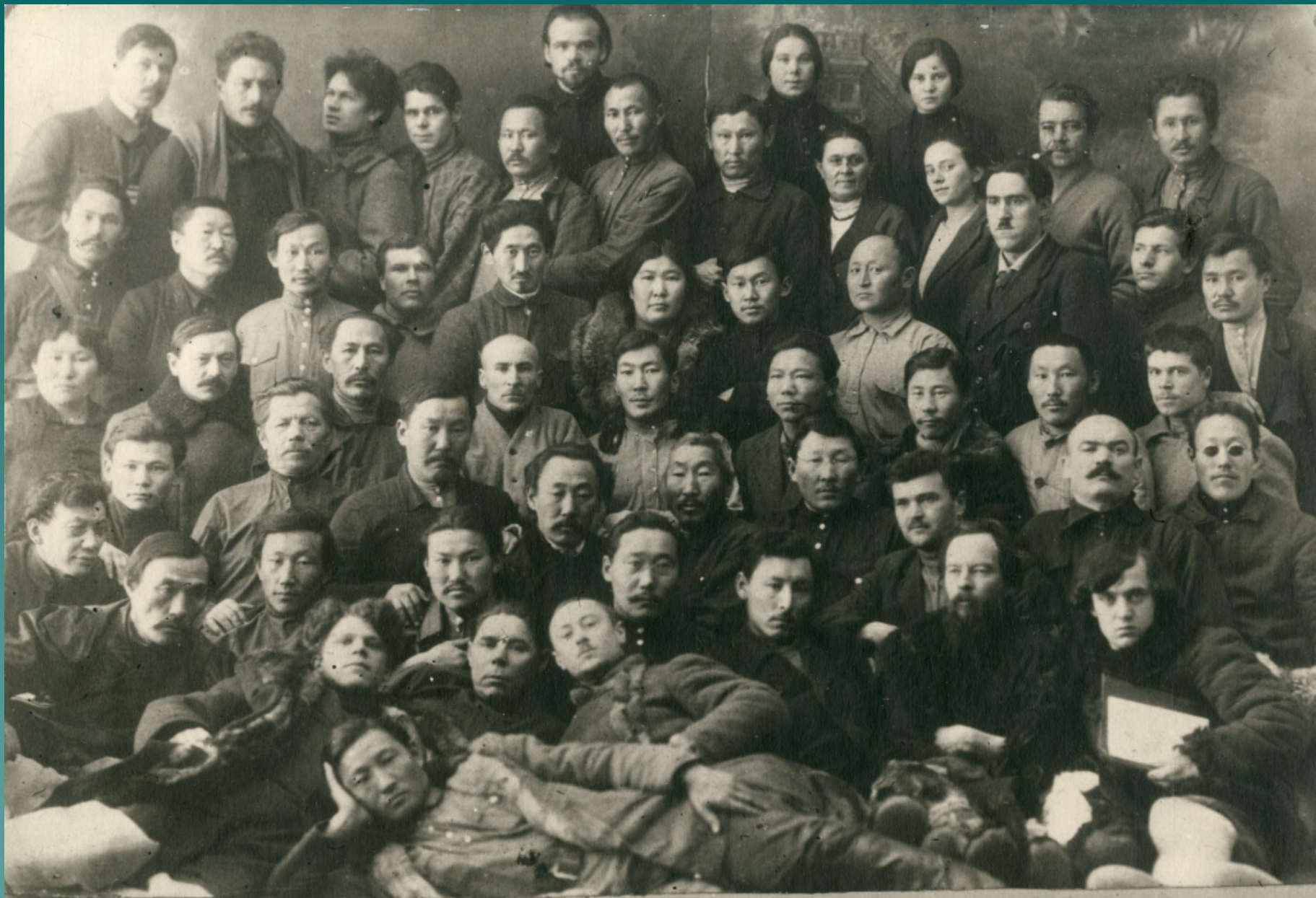
Головний відділ і Всеукраїнська Республіка Радянська.